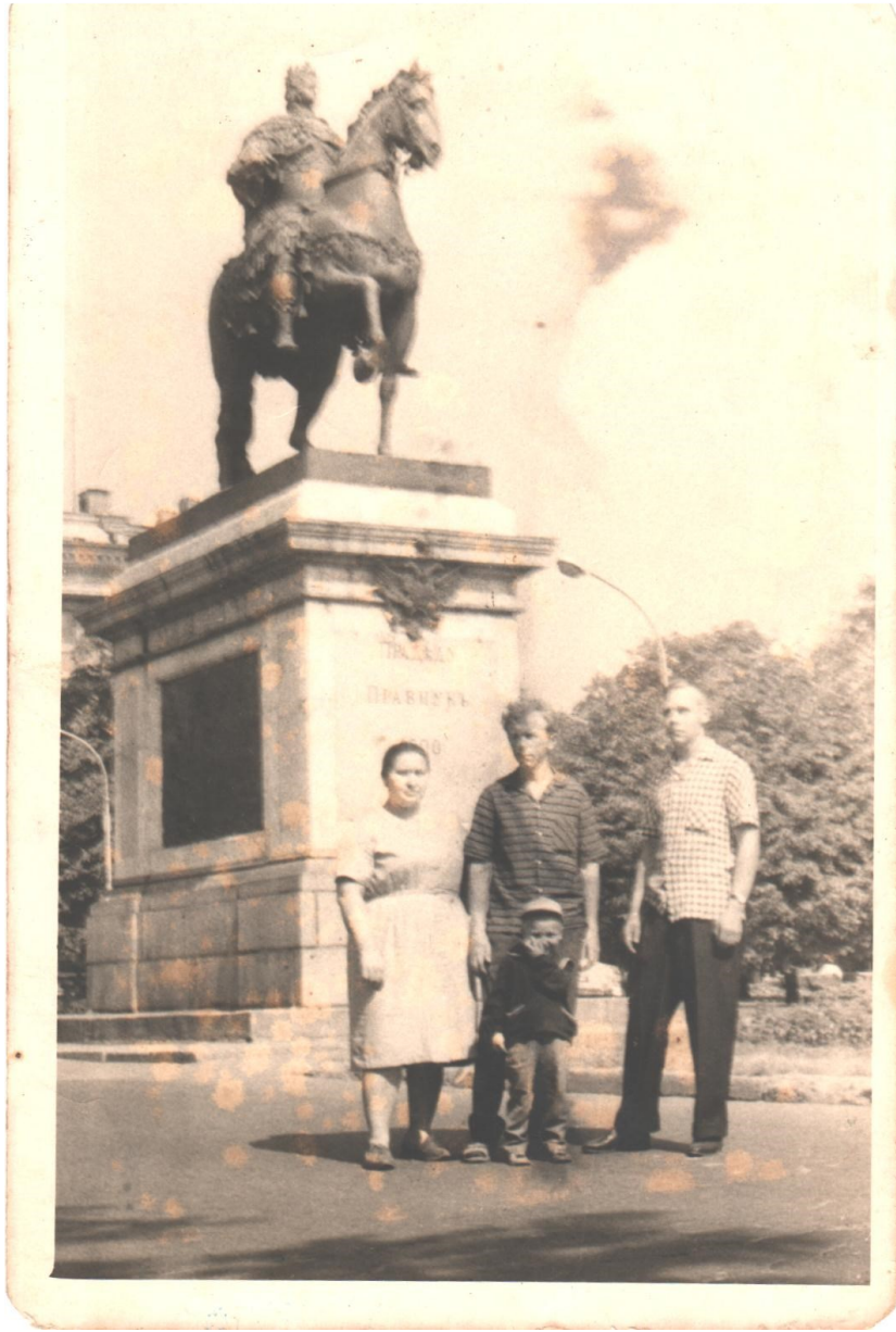
Семейная поездка в Санкт-Петербург в 1968 году.