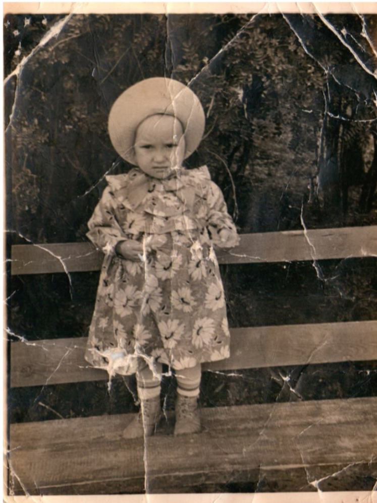
Это моя мама. Ей здесь 2 года.