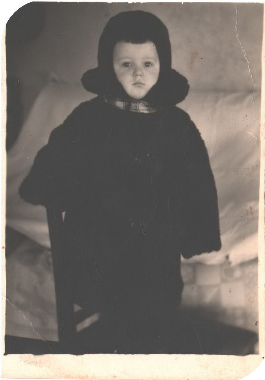
Мой папа в детстве. Ему 2 года.