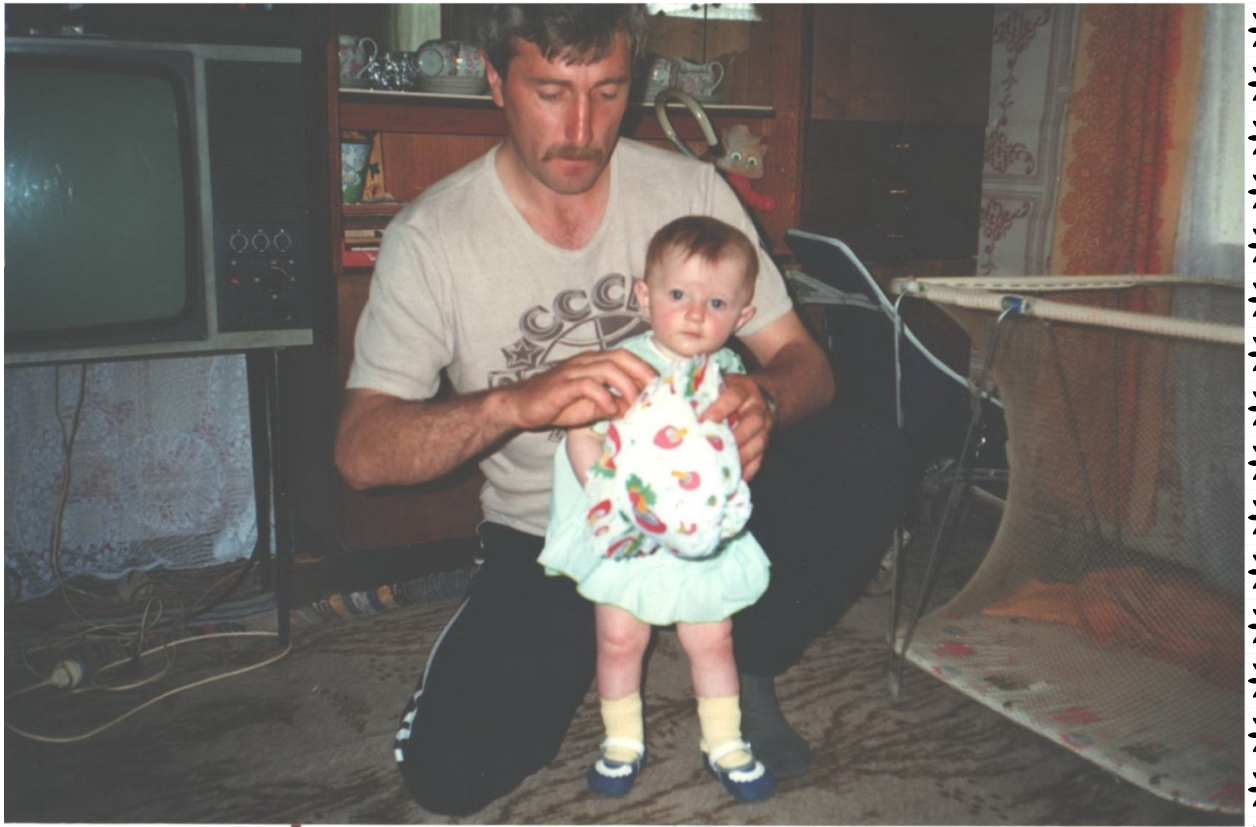
Мой папа и я, когда мне было 10 месяцев